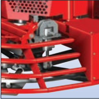
Hydraulic pitch control