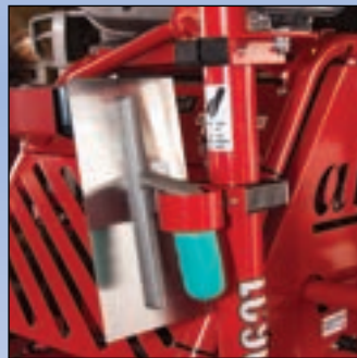
Handstålsfästen Justerbara handstålsfästen på varje sida.